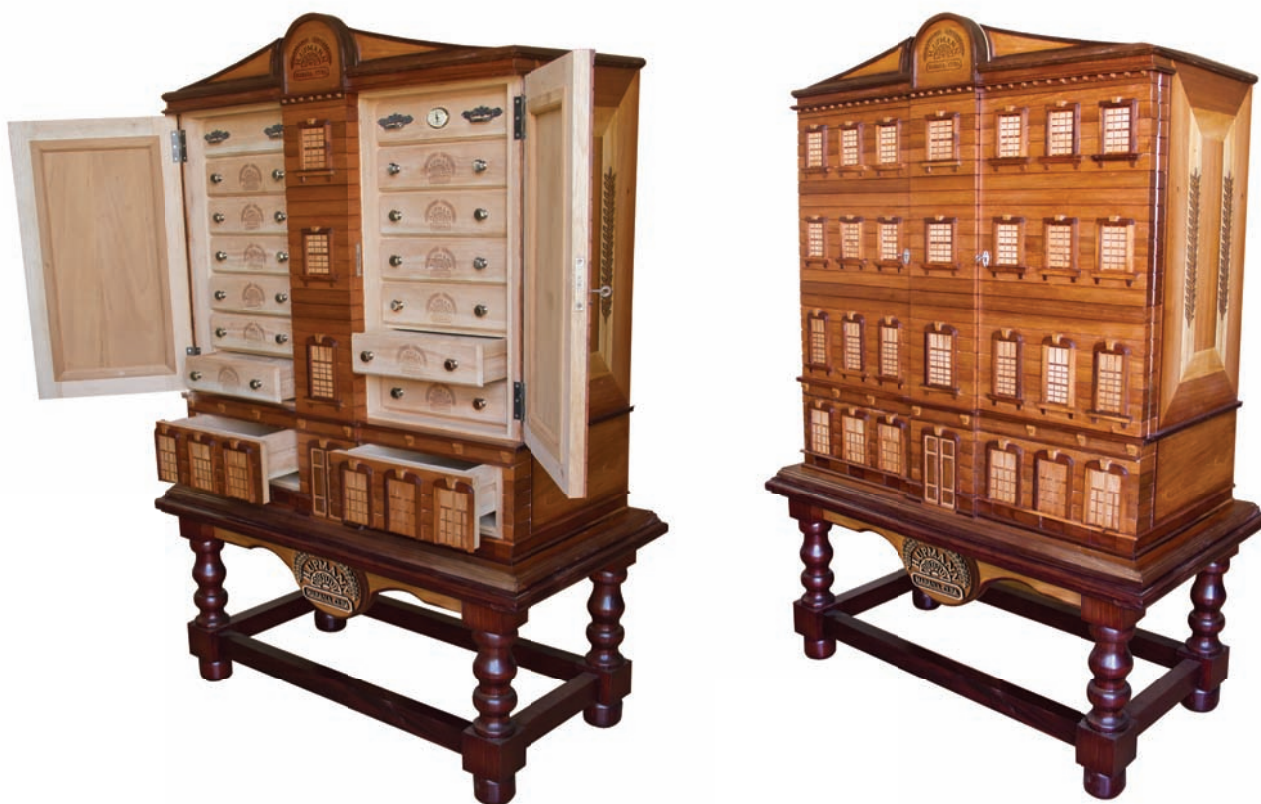
HUMIDOR H. UPMANN / H. UPMANN HUMIDOR