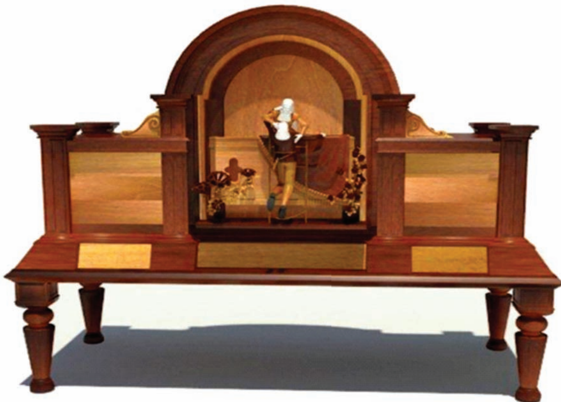
HUMIDOR ROMEO Y JULIETA / ROMEO Y JULIETA HUMIDOR