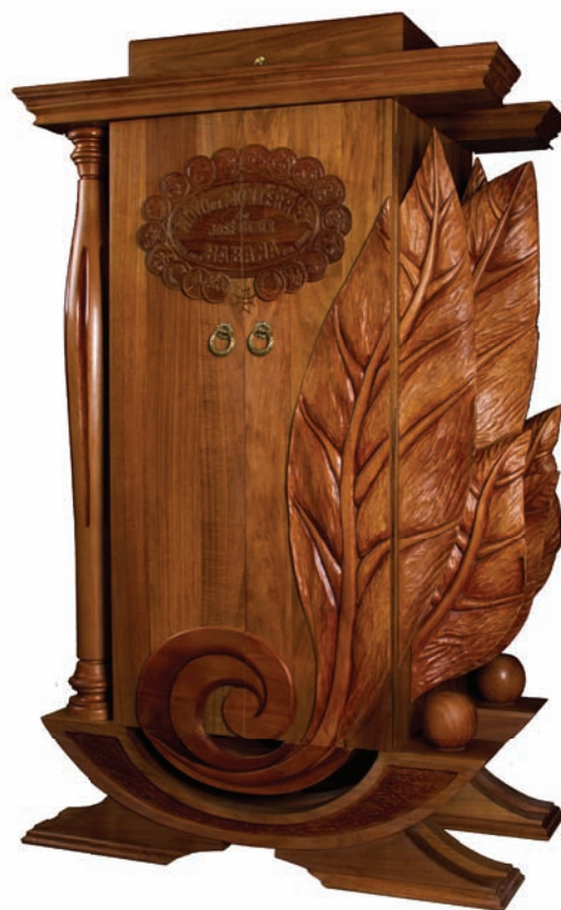
HUMIDOR HOYO DE MONTERREY / HOYO DE MONTERREY HUMIDOR