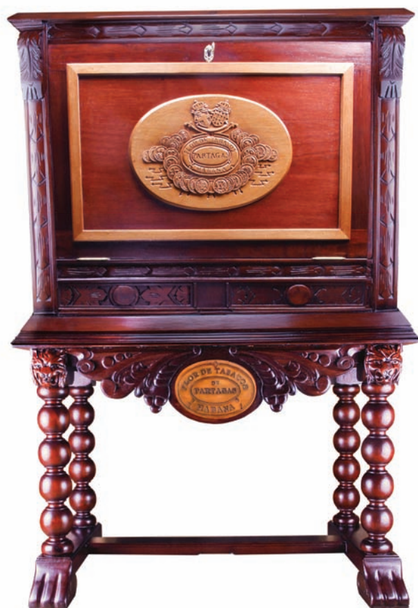
HUMIDOR PARTAGÁS / PARTAGÁS HUMIDOR