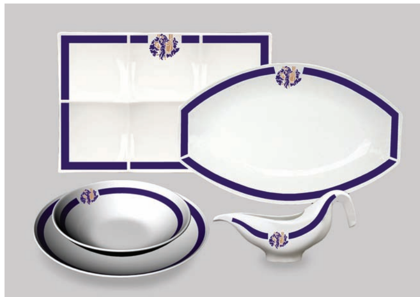
VAJILLA ROMEO Y JULIETA / ROMEO Y JULIETA CHINAWARE