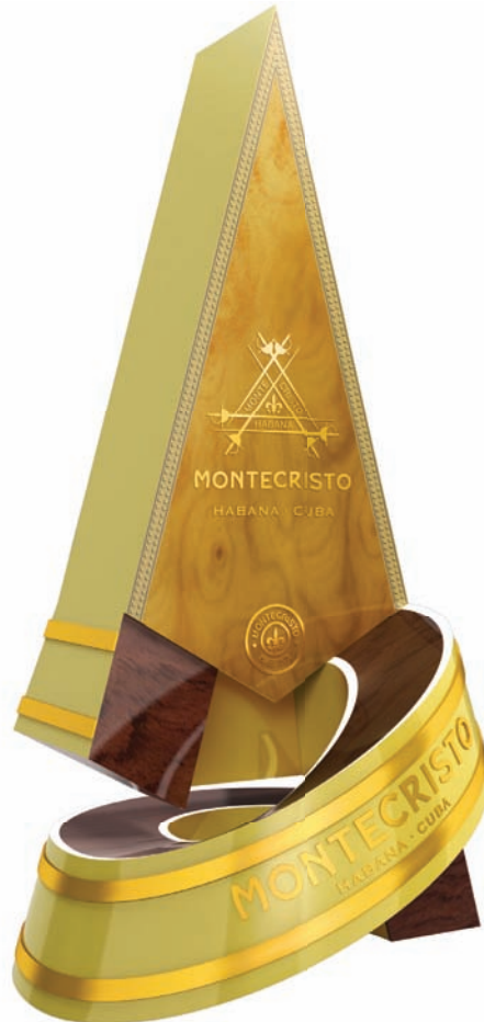
HUMIDOR MONTECRISTO / MONTECRISTO HUMIDOR

Humidif Group which includes HUMIDIF, BUCARO, DK AND LUXURY PACK brands with over 25 years of experience is a company that offers and sells a wide variety of products and accessories for the world of cigar, such as luxury humidors, cases, travel humidors, leather cigar cases, humidification systems, ashtrays, lighters, etc.